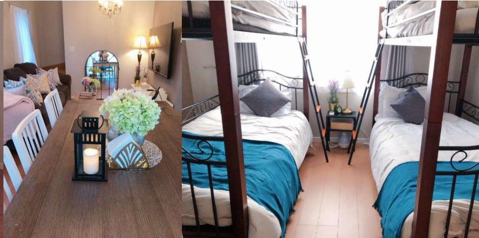
B棟 (Type B)